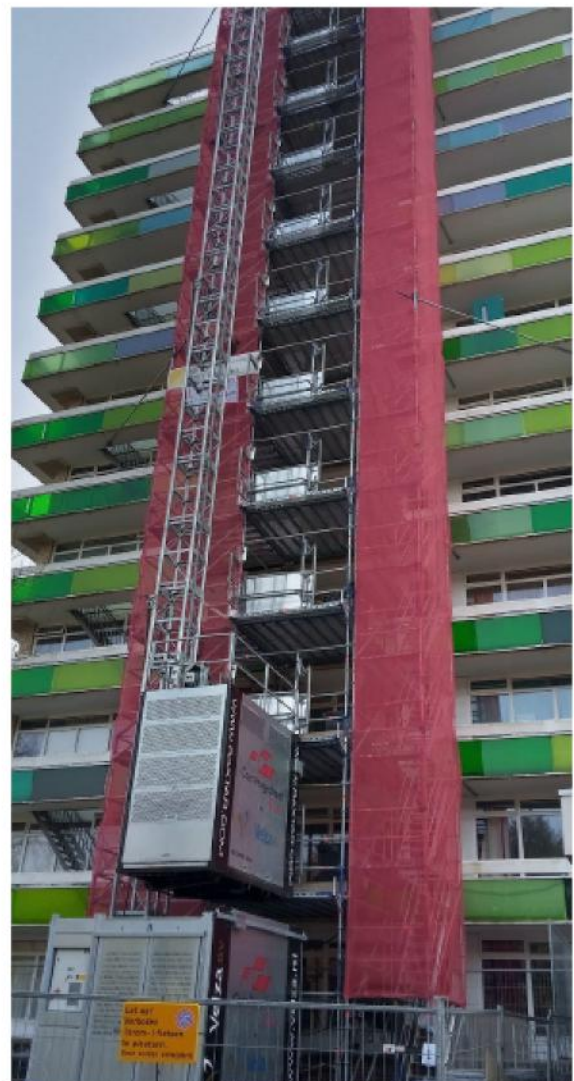
Voorbeeld van een bouwlift met trappentoren

Aan de achterkant wordt er ter hoogte van het trappenhuis een steiger met bouwlift en trappentoren geplaatst. Deze blijft gedurende het hele project staan.