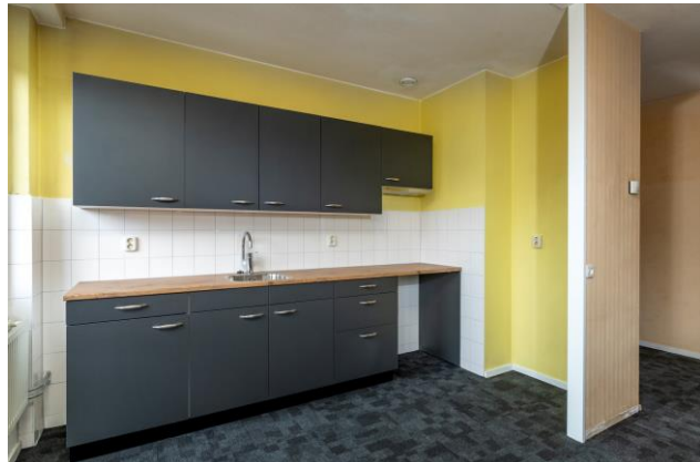
Keuken met betaalde opties