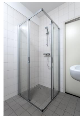
Badkamer met betaalde opties