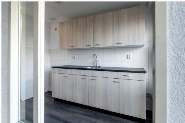
Keuken zonder keukendeur